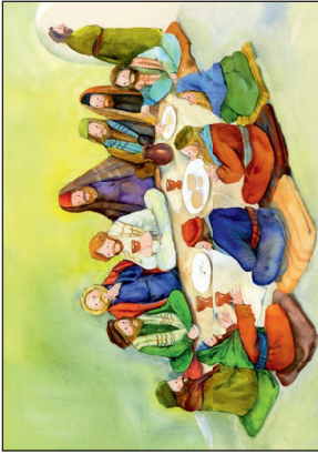
Jesus nimmt Abschied von seinen jüngern