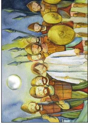
Jesus am Ölberg